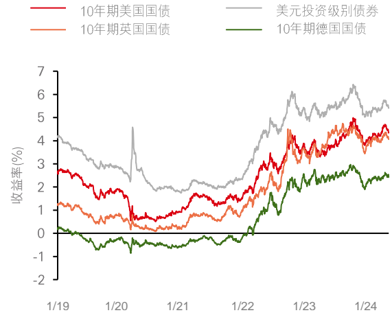
图1: 降息预期导致收益率见顶并促使更多投资者锁定目前水平

资料来源: 彭博、汇丰环球私人银行及财富管理, 截至 2024年5月21日。过去的表现并非未来表现的可靠指标。