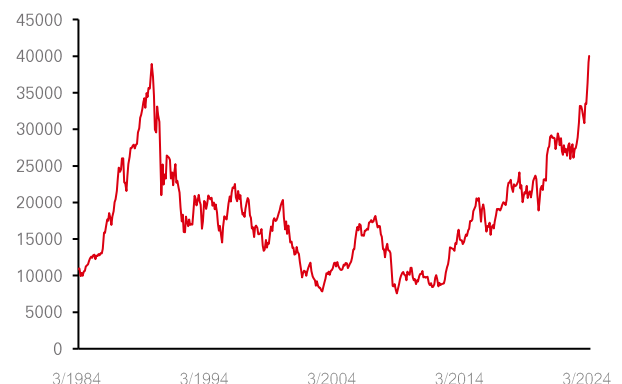
圖 3: 日本央行的鴿派指引帶動日本股市創歷史新高

過去的表现並非未來表现的可靠指標。