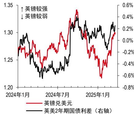
2. 英镑兑美元汇率及英美利差